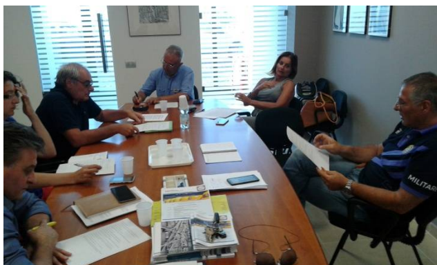
Macerata, Ordine degli Ingegneri - 23 agosto

Si è lavorato tra il 23 ed il 28 ad un documento condiviso da inviare alla stampa e da seguire come traccia negli interventi il giorno della conferenza stampa che si allega al presente Report.